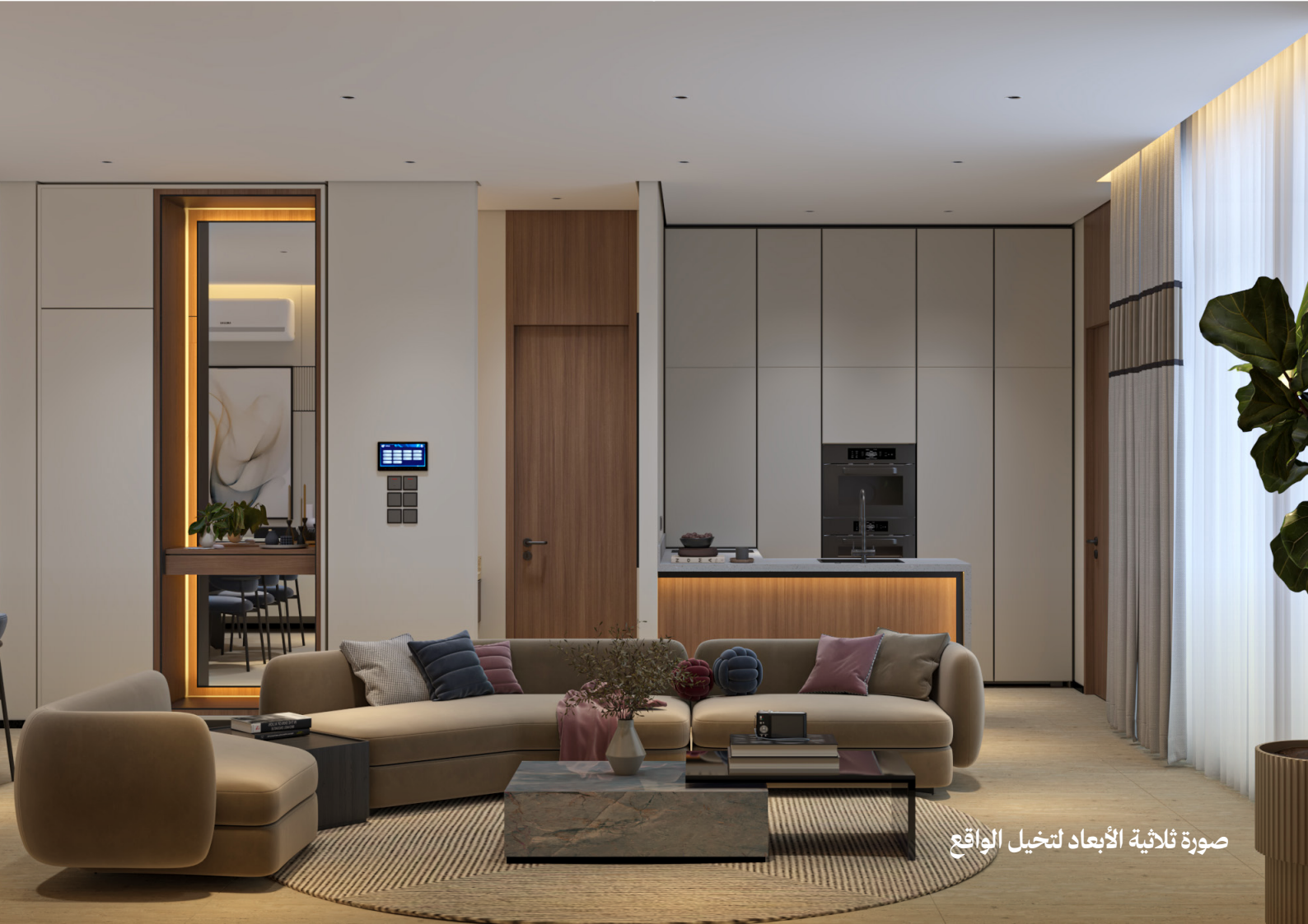
صورة ثلاثية الأبعاد لتخيل الواقع