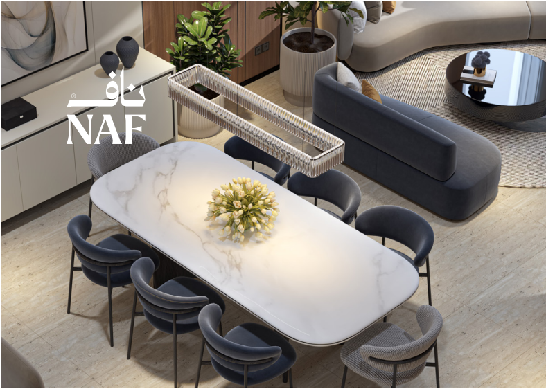
ناف 7 | نموذج فيلا روف